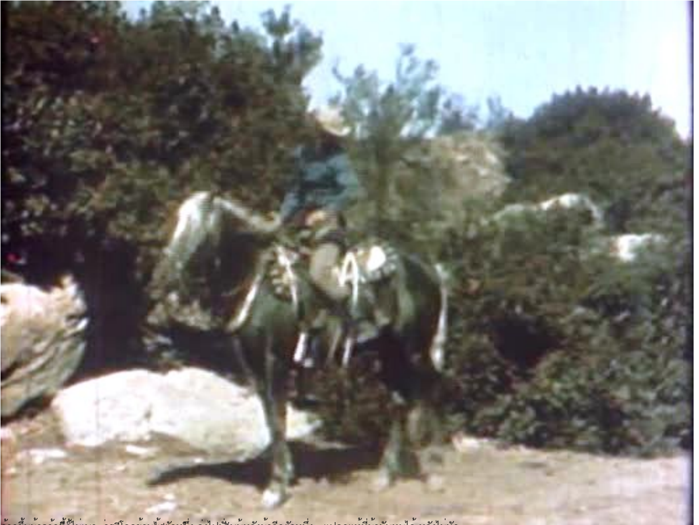
ม้าเลี้ยงจำนวนมากที่ด้อมตมแดงเสียดูทงเม่ปัสยาในเต่งลงกับบั้นหลังรักมีฮัดหนึ่ง แปกแทที่ม้ามันทนได้ หลงไม่หัก

วันจันทร์ที่ 21 กุมภาพันธ์ 2011 เวลา 18:22 น. - แก้ไขล่าสุด วันอังคารที่ 13 กุมภาพันธ์ 2018 เวลา 18:31 น.