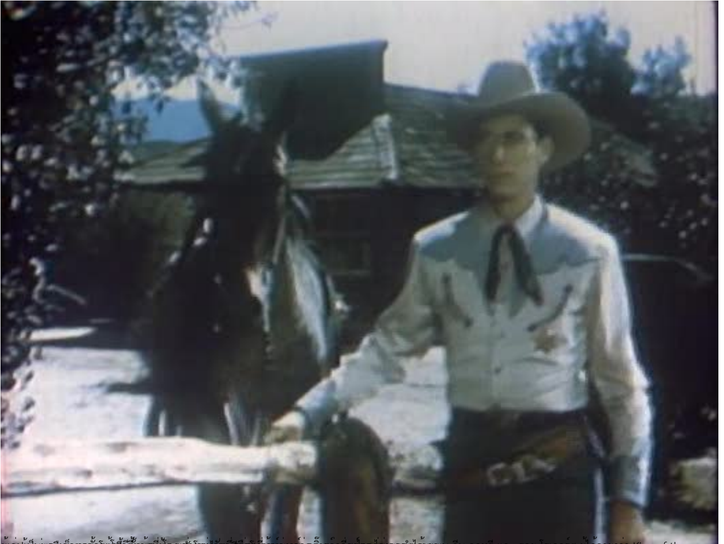
ผู้เขียนหนังสือเกี่ยวกับชีวิตของม้าป่าแสนรู้ได้เขียนเกี่ยวกับม้าป่าแสนรู้ที่ชื่อ King of the