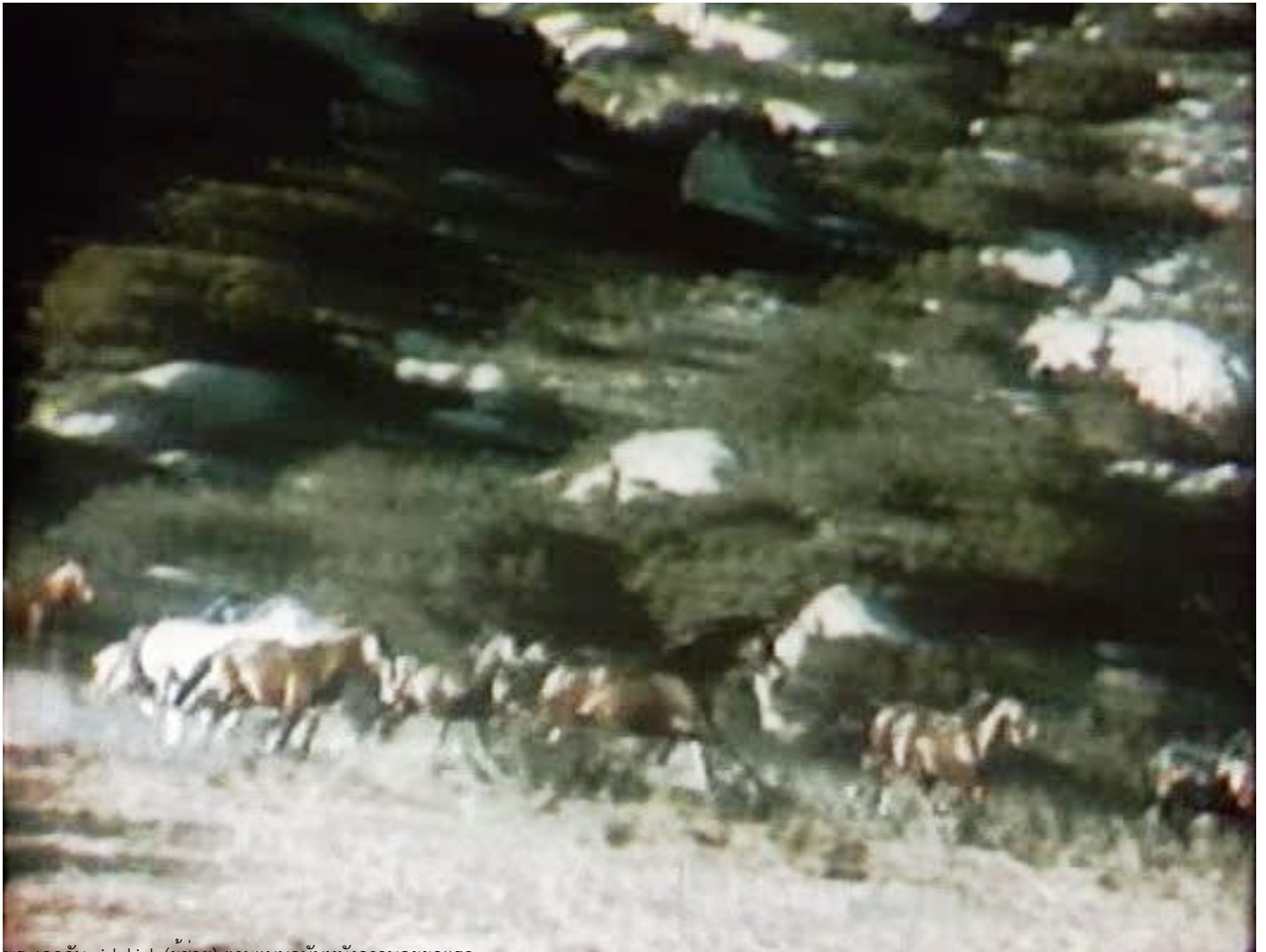
พระเอกกับ sidekick (ผู้ช่วย) ตามแบบฉบับหนังควาบอยยุคแรก

วันจันทร์ที่ 21 กุมภาพันธ์ 2011 เวลา 18:22 น. - แก้ไขล่าสุด วันอังคารที่ 13 กุมภาพันธ์ 2018 เวลา 18:31 น.