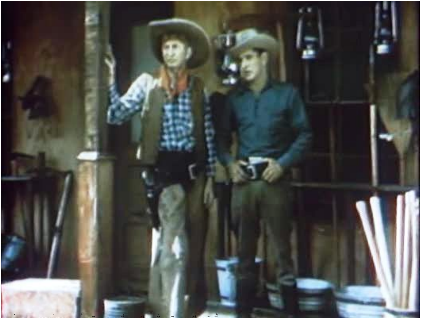
ฉากต่างๆ และการแต่งกายแบบต้นฉบับคาวบอยที่กลายเป็นแฟชั่นตะวันตกจนถึงทุกวันนี้