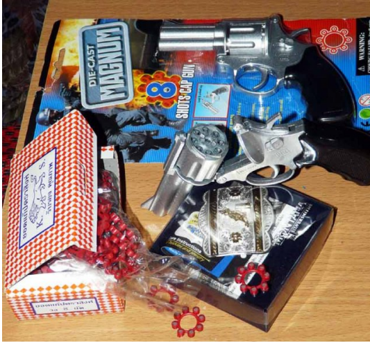
คนเรายังแก๊ยังคิดถึงความหลัง

เห็นปืนเด็กเล่นของ P_POP แล้ว คิดถึงตอนเป็นเด็กเหมือนกัน อายุพอๆ กับในรูปของคุณแหละ ผมชอบเล่นปืนแก๊ป เอาไม้กระดานมาทำเอง ทุ่มด้วยสังกะสี ใช้หนังยางเป็นตัวดึงนกปืน ยิ่งเสียงดังสนั่นหมู่บ้าน ยิ่งที่มีมือชาเลย บางครั้งมันระเบิดแรงจนไม้ส่วนล่างล่องปืนแตกกระเด็นออกไป