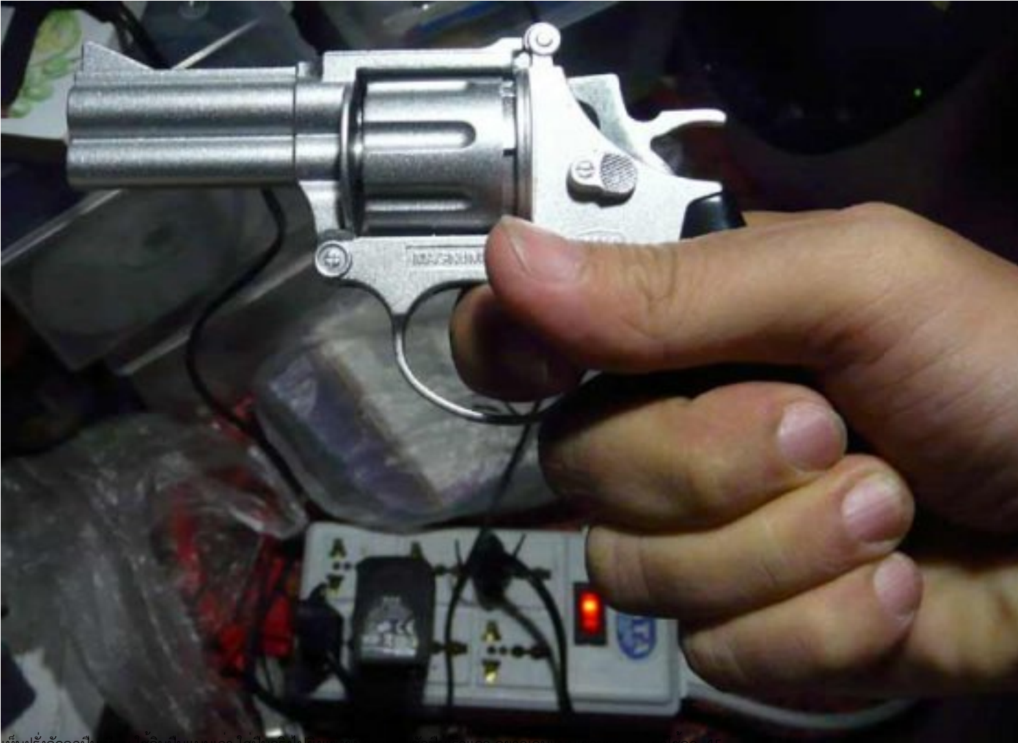
เห็นฝรั่งอัดลูกปืนเทอน เซตฉบับแบบเก่า โสบนงรงบองแจงชนคาวบอยขกบนเรวแล้ว อยากเล่นแบบเขามกเลย เขาใช้ลูก .45